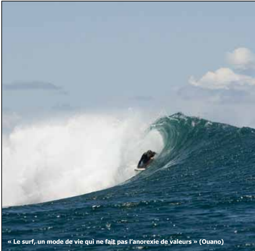
« Le surf, un mode de vie qui ne fait pas l'anorexie de valeurs » (Ouano)